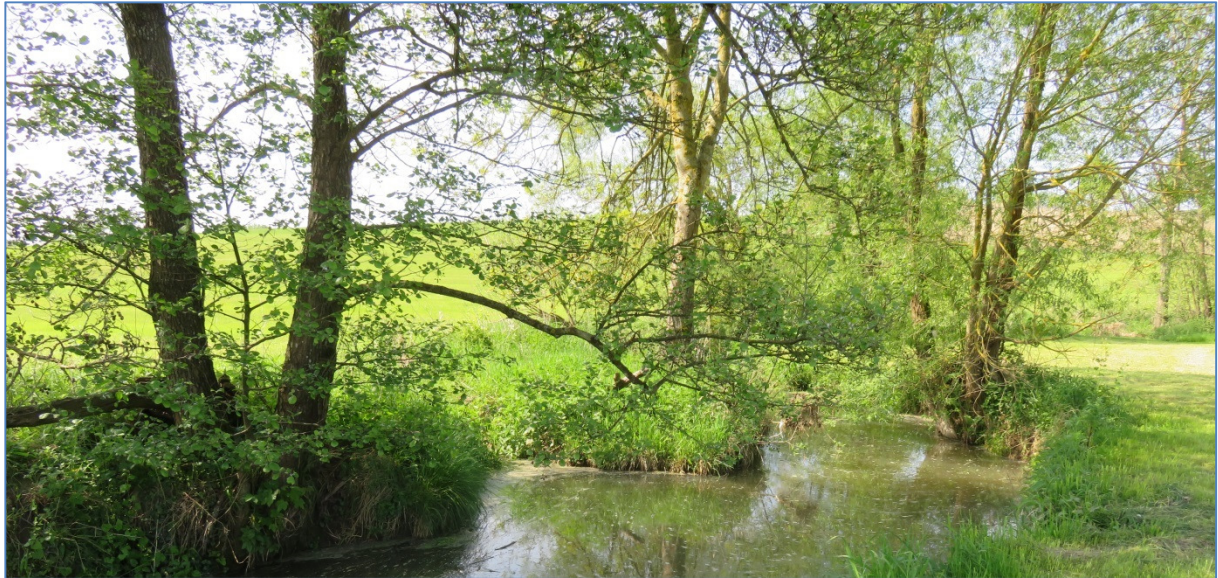
Abb. 1: Oberlauf der Ussel