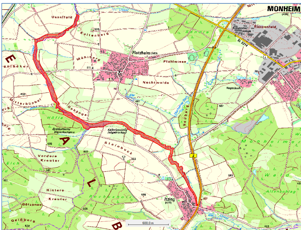
Abb. 2: Übersichtskarte: FFH-Gebiet 7130-372 „Oberlauf der Ussel bis Itzing“ (rot dargestellt)

Der Plan wird von der Regierung von Schwaben zusammen mit der Unteren Naturschutzbehörde des Landratsamtes Donau-Ries und dem Amt für Landwirtschaft und Forsten Krumbach (Schwaben) erarbeitet. Zur Abstimmung mit den Betroffenen, vor allem Grundbesitzern, Bewirtschaftern und Kommunen, wird ein „Runder Tisch“ eingerichtet. Durch eine möglichst breite Akzeptanz der Ziele und Maßnahmen soll die Voraussetzung für eine erfolgreiche Umsetzung geschaffen werden. Denn nur durch gemeinsames Handeln können wir die vielfältigen Kulturlandschaften unserer bayerischen Heimat bewahren und dazu beitragen, das europaweite ökologische Netz Natura 2000 zu sichern.