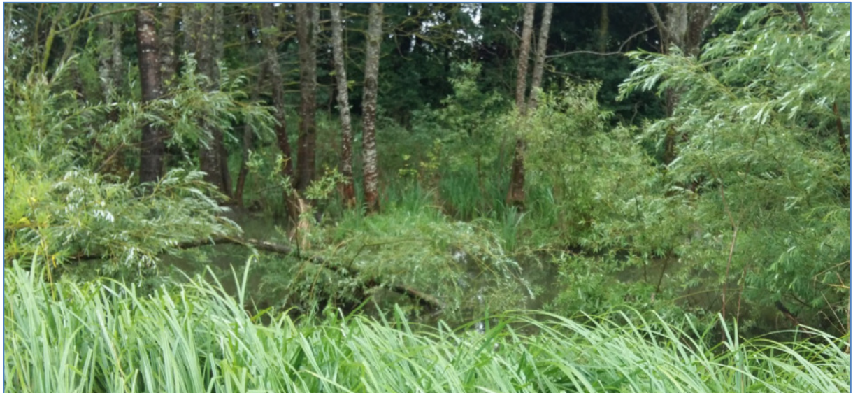
Abb. 4: Weichholzauwald im FFH-Gebiet „Oberlauf der Ussel bis Itzing

Die Weichholzauwälder begleiten in einigen Abschnitten die Ussel. Hauptbaumarten sind Eschen, Erlen und Weiden. Der Unterbewuchs besteht vor allem aus Brennnessel. Aufgrund hohen Nährstoffeintrages von der umgebenden landwirtschaftlichen Nutzung und fehlender Pufferstreifen ist dieser LRT stark eutrophiert. Dies macht sich vor allem durch eine veränderte Krautschicht bemerkbar. Der Lebensraumtyp nimmt im FFH-Gebiet eine Fläche von 2,26 ha ein. Insgesamt ist der Erhaltungszustand der Weichholzauwälder (LRT 91E0*) im FFH-Gebiet mittel bis schlecht (C).