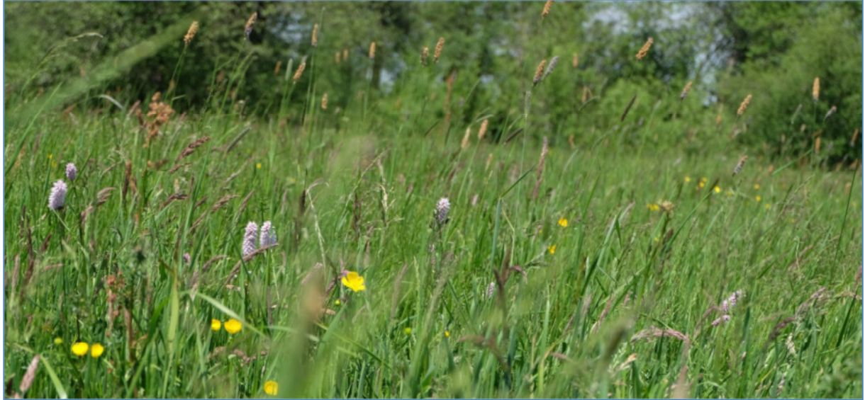
Abb. 3: Magere Flachland-Mähwiese im FFH-Gebiet „Oberlauf der Ussel bis Itzing

Flachland-Mähwiesen sind artenreiche, extensiv genutzte Mähwiesen. Im FFH-Gebiet befindet sich nur eine Flachland-Mähwiese der frisch-feuchten Ausbildung mit einer Größe von 0,54 ha. Lebensraumtypische Arten sind nur noch eingeschränkt in Form der Wiesen-Flockenblume ( Centaurea jacea ) und des Wiesen-Bockbarts ( Tragopogon pratensis ) vorhanden. Insgesamt ist der Erhaltungszustand der Flachland-Mähwiese im FFH-Gebiet mittel bis schlecht (C).