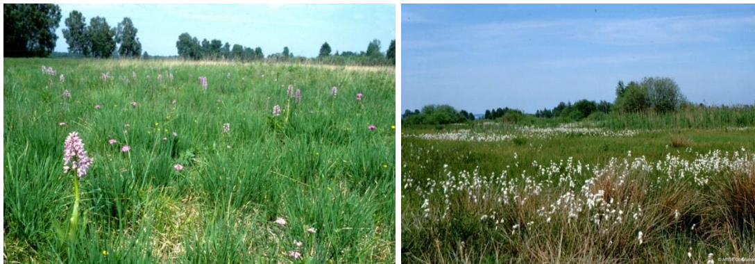
Abb. 3: Pfeifengraswiese mit Helmknabenkraut, sog. „Blumenwiese“ (linke Abbildung) und Kalkreiches Niedermoor (rechte Abbildung).

Neben dem in der Regel bestandsprägenden, namensgebenden Pfeifengras kommen folgende charakteristische und wertgebende, darunter auch stark gefährdete Pflanzenarten vor, wie z.B. Knollen-Kratzdistel, Prachtnelke, Sumpfstendelwurz, Fleischfarbendes Knabenkraut, Mückenhändelwurz, Helmknabenkraut, Mehlsprimel, Färbescharte, Kugel-Teufelskralle, Großer Wiesenknopf, Trollblume, Grabenveilchen. Ein Großteil der seltenen und gefährdeten Pflanzenarten hat innerhalb des Leipheimer Moores in diesem Streuwiesenkomplex seinen Verbreitungsschwerpunkt bzw. kommt fast ausschließlich dort vor. Der Gesamterhaltungszustand der Pfeifengraswiesen im FFH-Gebiet ist mit (B) gut bewertet.