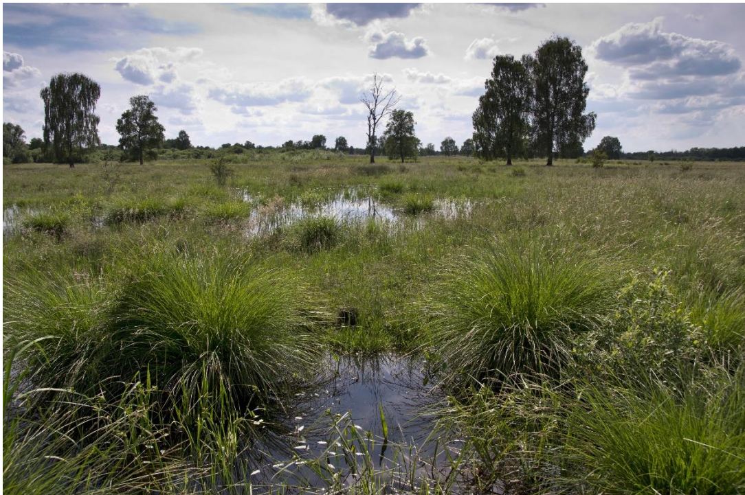
Abb. 1: Leipheimer Moos

Kurzinfo zum Managementplan – Stand Dezember 2021