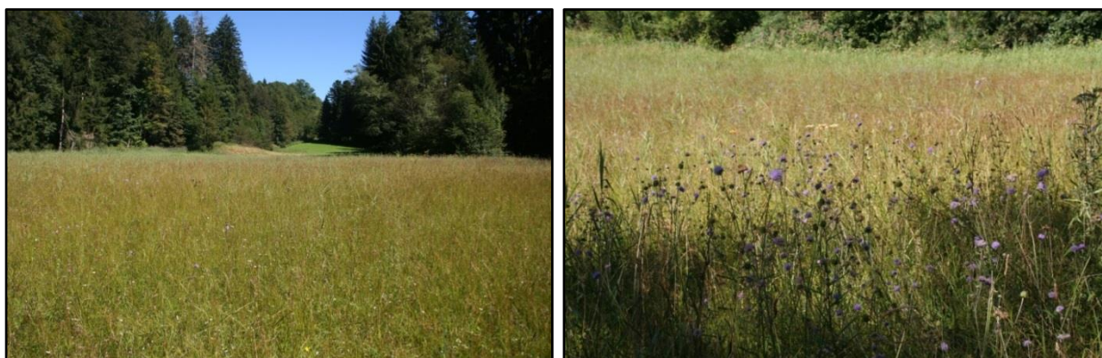
Abbildung 1: Kalkflachmoor und Pfeifengraswiese bei Sigmarszell

An Leiblach und Oberreitnauer Ach kommen sechs Lebensraumtypen nach Anhang I der FFH-Richtlinie vor. Der Lebensraumtyp Pfeifengraswiesen (LRT 6410) tritt an einer Stelle, einem Flachmoor südlich von Sigmarszell auf, in enger Verzahnung mit einem Kalkreichen Niedermoor (LRT 7230), beide befinden sich in hervorragendem Erhaltungszustand (A). Feuchte Hochstaudenfluren (LRT 6430) sind nur kleinflächig ausgeprägt (Erhaltungszustand B).