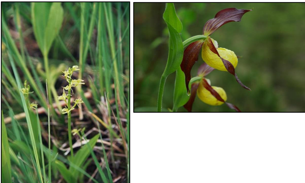
Abbildung 4: Sumpf-Glanzkraut und Blühender Frauenschuh

Auch der im Standarddatenbogen gemeldete Frauenschuh ( Cypripedium calceolus ) konnte an einem Standort an der Leiblach bestätigt werden. Aufgrund der sehr geringen Population weist er allerdings nur einen mäßig bis schlechten Erhaltungszustand auf (C).