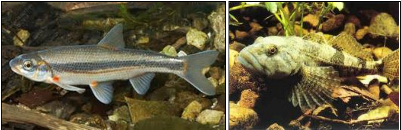
Abbildung 3: Die FFH-Fischarten Strömer (links) und Groppe

Bei den Vorkommen handelt es sich um die einzigen bekannten stabilen Populationen des Strömers in Bayern.